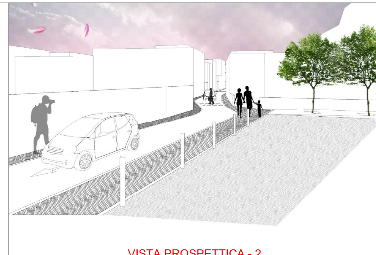
VISTA PROSPETTICA - 2