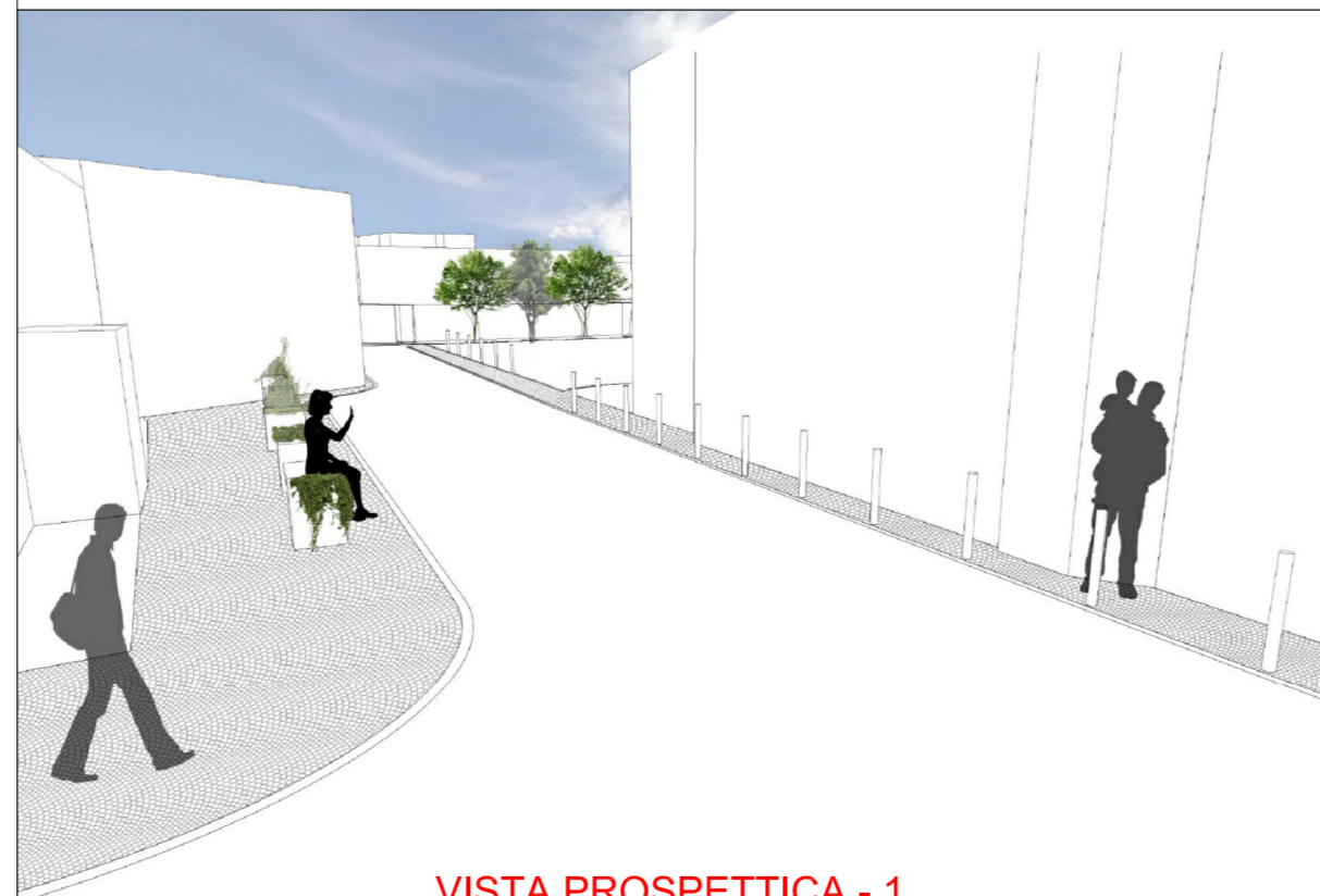
VISTA PROSPETTICA - 1