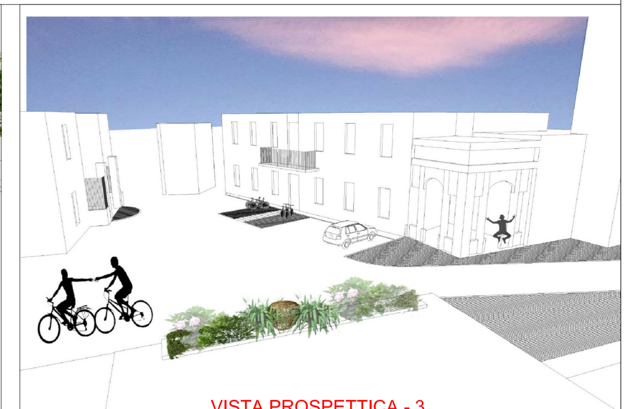
VISTA PROSPETTICA - 3